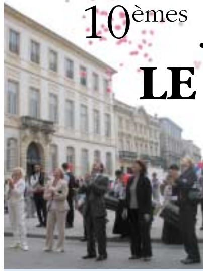
Lâcher de ballons lors de l'inauguration festive