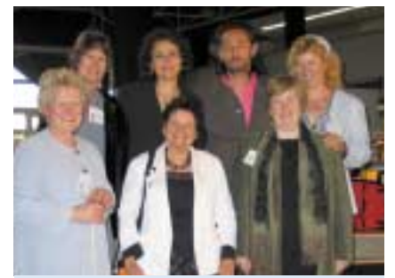
Le jury du Concours International de Harpe Celtique