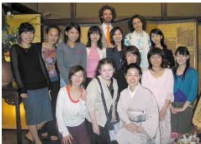
Les stagiaires de la 1 ère Académie de Harpe de Kyoto

Directrice de la Kyoto Nichi-Futsu Harpe-Juku (l'Académie Franco-japonaise de Harpe de Kyoto)